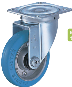
420S-RB 100mm (帯電防止車輪付)