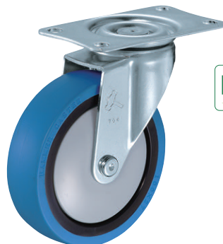
420BBE-UZ 100mm (帯電防止車輪付)