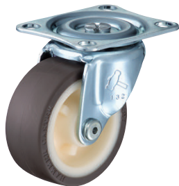
420G-UR 65mm (帯電防止車輪付)