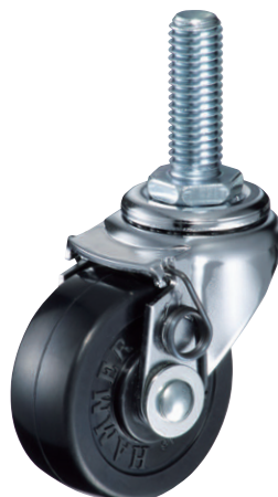
420EA-R 50mm セルフ