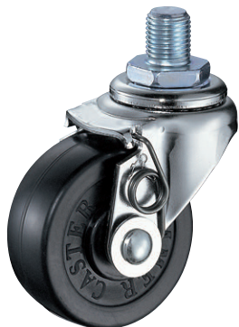
420A-R 50mm セルフ