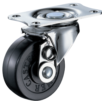
420E-R 50mm セルフ

4005-200 ラジアルボールベアリング 615S/SA/5K 420F05/FAS 400F05/FAS 420E/A/EAセルフ 420TP シヨッピングカート用 オートライン用 コストパフォーマンス 軽量ハイスペック HBN車 導電/帯電防止 耐熱キャスター