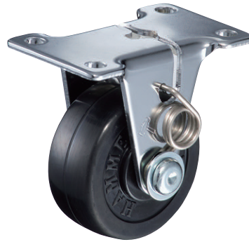
420ER-R 50mm セルフ