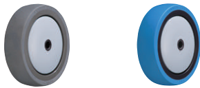
導電ウレタン車輪 帯電防止ウレタン車輪